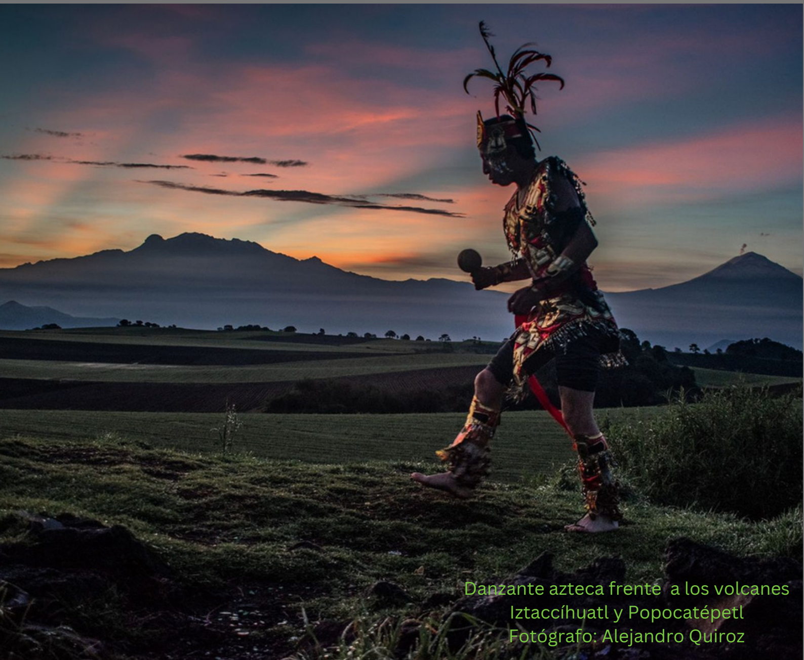
Danzante azteca frente a los volcanes Iztaccíhuatl y Popocatépetl

Museo Nacional de Historia "Castillo de Chapultepec" El Colegio de México Museo Nacional de Antropología Dirección de Estudios Históricos - INAH Biblioteca Nacional de Antropología e Historia MAYO 23-25, 2024, CIUDAD DE MÉXICO